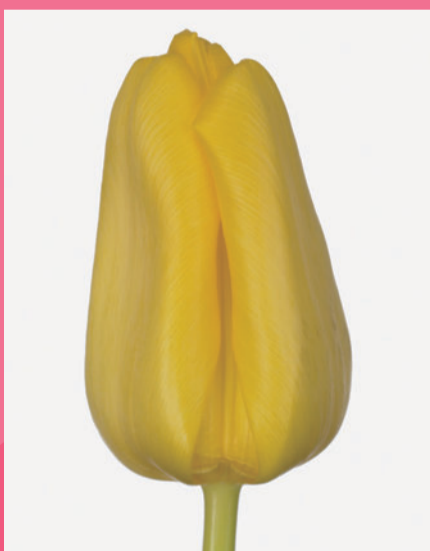
ライオンズグローリー Lion's Glory