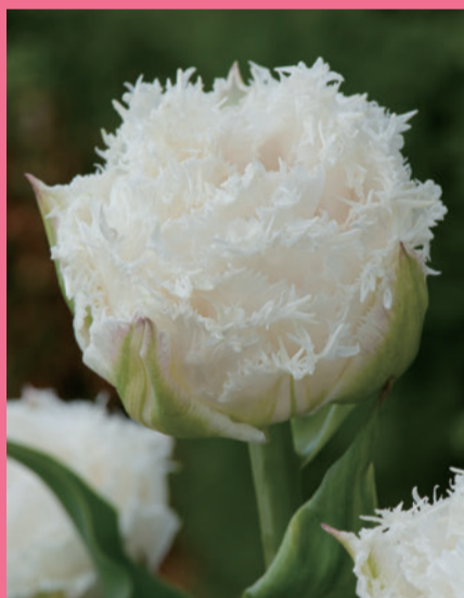
スノークリスタル Snow Crystal