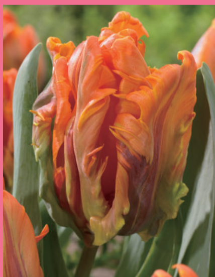
イレーネパロット Irene Parrot