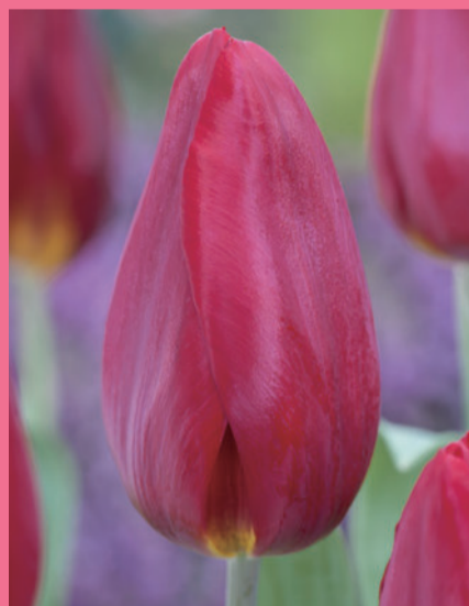
ストロングラブ Strong Love