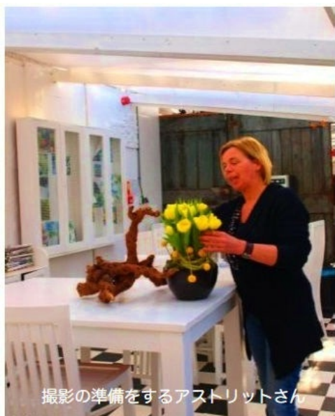
撮影の準備をするアストリットさん