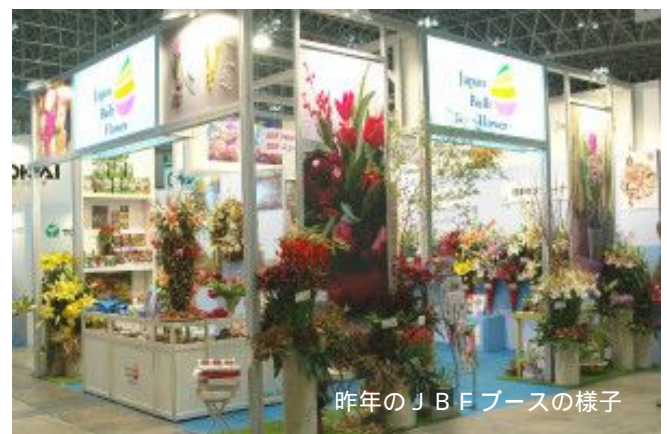
昨年のJBFブースの様子

今年の展示では、日本で栽培されるユリとチューリップを中心とした球根切り花の展示と球根販売のさまざまなアイデアをご紹介します。豊かな品種構成と品質の高さを誇る「国産ユリ」切花のほか、昨年に引き続き、「ホームスイートバルブ Home Sweet Bulb プロジェクト(花芽つき鉢植え球根)」もご案内いたします。