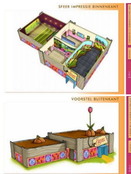
フロリアード 2012、IBC の展示館イメージ

大型イベントにつきもののファイナンス面での難点も、この2012年のフロリアードはひと味違ったものになるという。主催者側は史上初の黒字フロリアードを目指すと言っている。開催にかかるコストは約8000万ユーロということだが、これをまかなうための資金は入場者からの収入がメインになる。約200万人の入場者が見込まれており、入場料、駐車料、パーク内でのその他の出費が主である。入場者の80万人はオランダ人、80万人は隣国ドイツ人、その他の40万人は他国からという予測となっている。