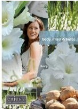
夏咲き球根を楽しもう